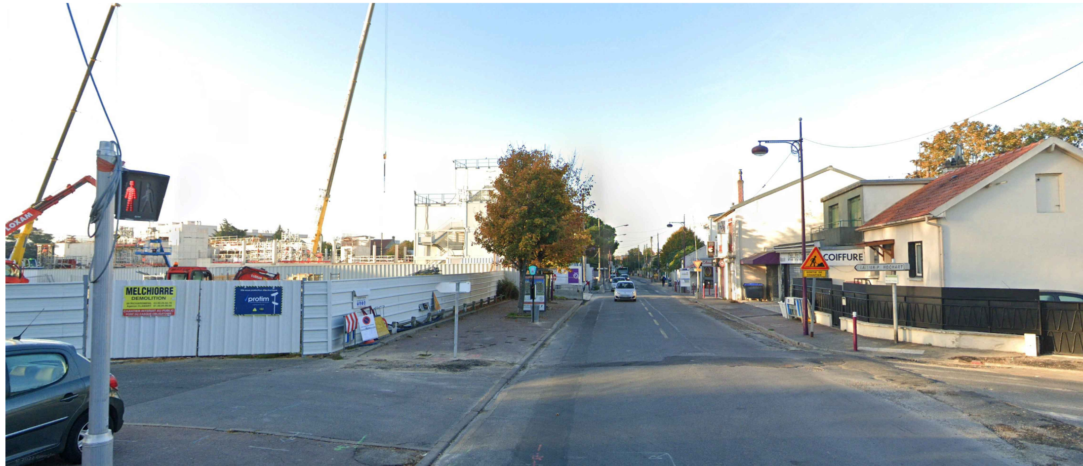
PC 08.1 : Vue 5