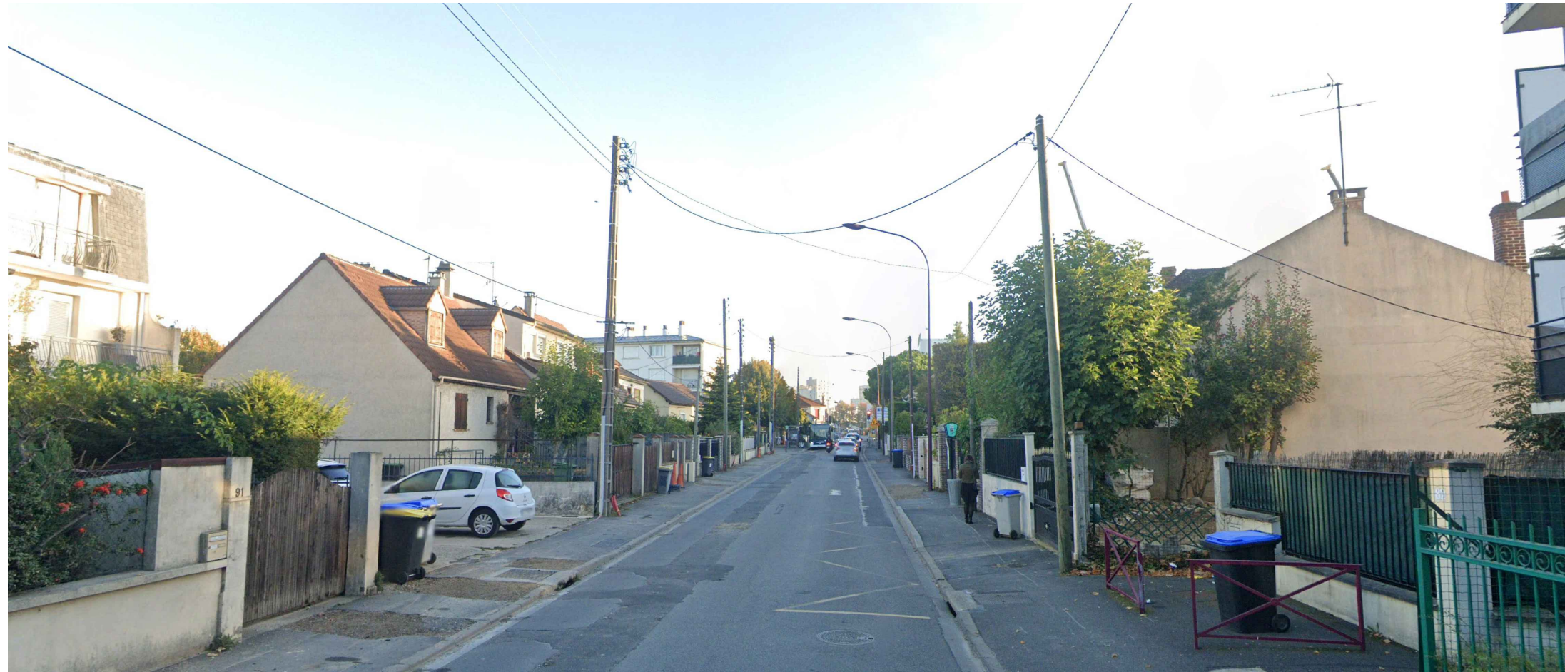
PC 08.3 : Vue 7