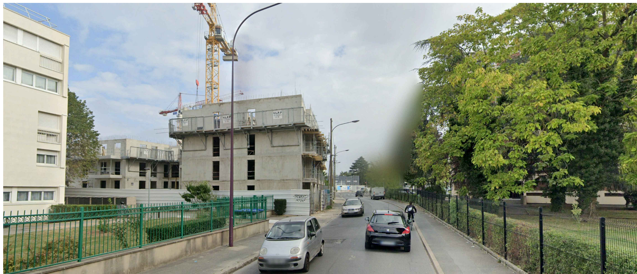
PC 08.4 : Vue 8