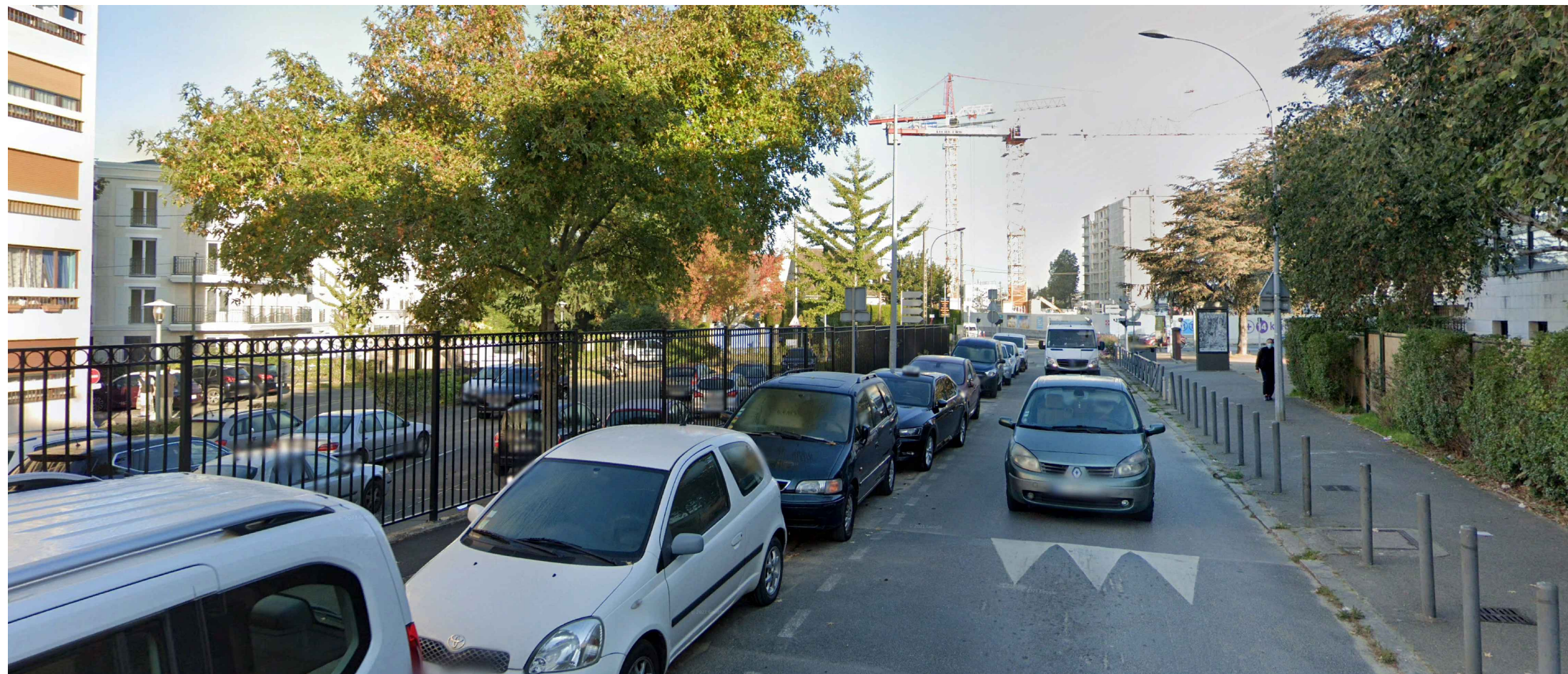
PC 08.2 : Vue 6