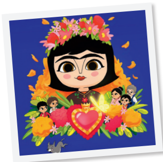
Une petite fille différente, l'histoire de Frida Kahlo