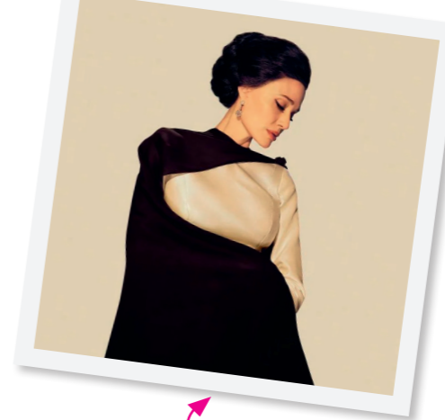
Maria Callas, le biopic d'une cantatrice devenue légende