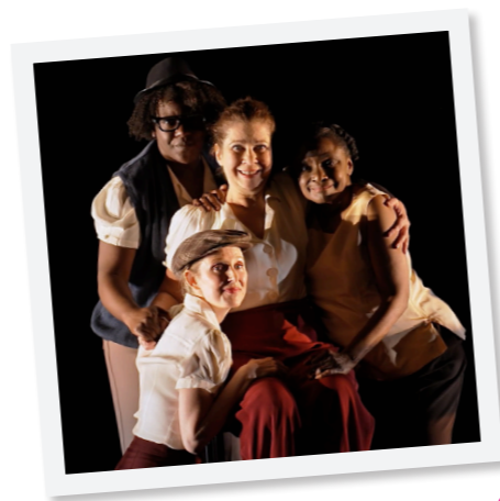
Maya finira-t-elle par retrouver sa voix ?